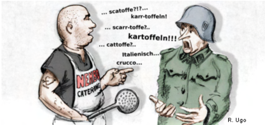
Quelli della Nembo non furono ausiliari dei tedeschi